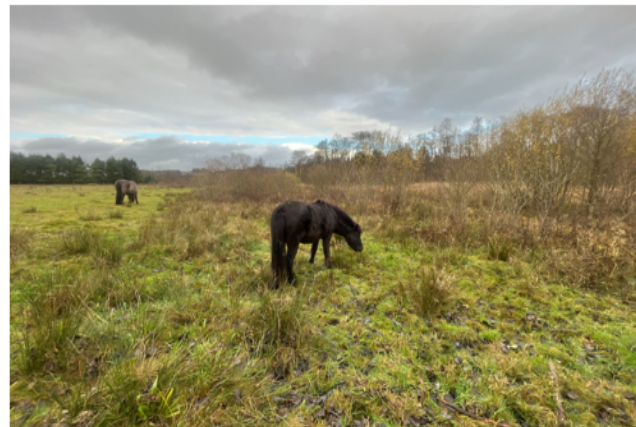
Totalbillede af græsningsaktivitet og dyr

Billede-eksemplerne foroven viser alle en godkendt græsningsaktivitet. Der er altså ikke tale om at arealet skal være helt nedbidt, men alene vise en ekstensiv græsningsform, hvor der gerne må være forekomst af ikke-afbidte græsningsområder. Der er særligt det forhold, at man kan se, at dyrene enten har været der eller, at der går husdyr på arealet i dokumentationsperioden, som samlet set er afgørende for om arealet kan godkendes eller ej.