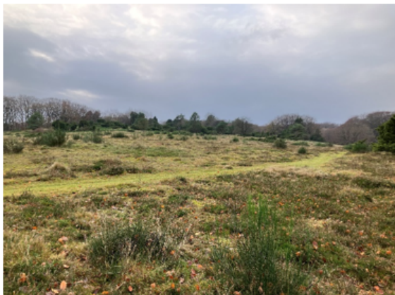
Afgræsset vegetation (græs) på hedearreal