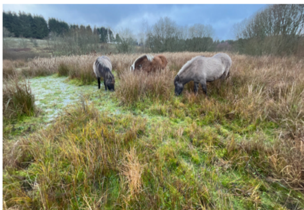
Nærbillede af græsningsaktivitet og dyr