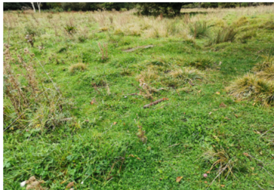
Totalbillede af varieret afbidningsmønstre – enkelte delområder afbidt og andre delområder viser urørte tuedannelser, der tilsammen angiver en aktivitet