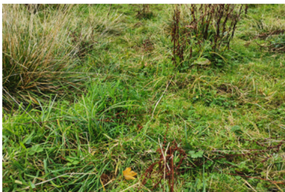
Varieret (lavt/højt) plantedække som følge af afgræsning