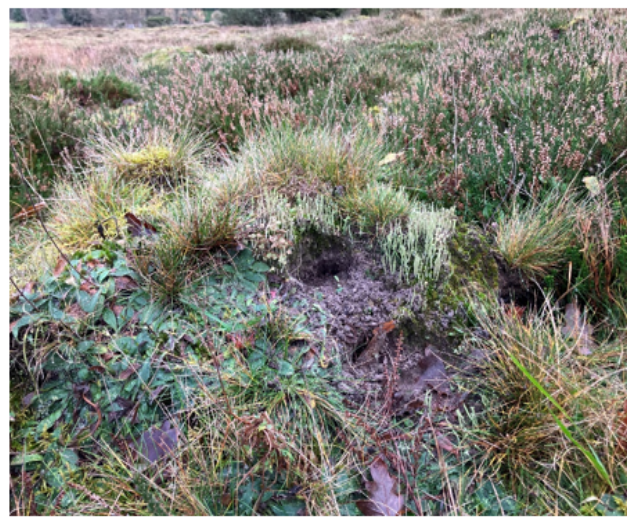
Nærbillede af nedbidt tue og klovspor