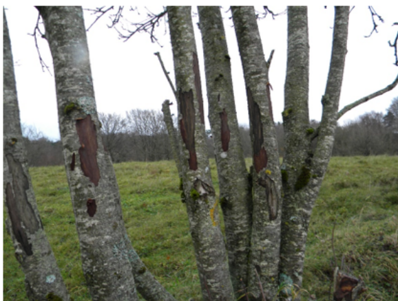
Totalbillede af barkskrab med afbidt græs bagved