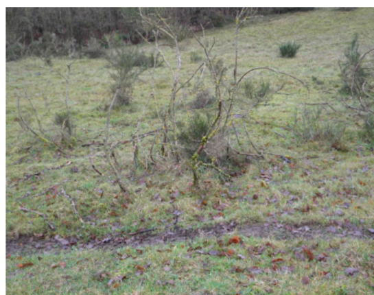
Terrænforskelle med nedbidte buske, afgræsset baggrund og friske dyreveksler (bar jord)