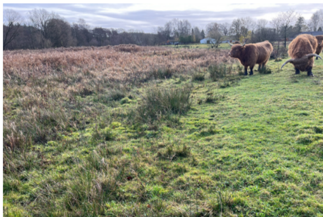
Totalbillede af græsningsaktivitet og dyr