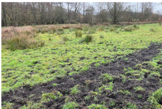
Nærbillede af græsningsaktivitet