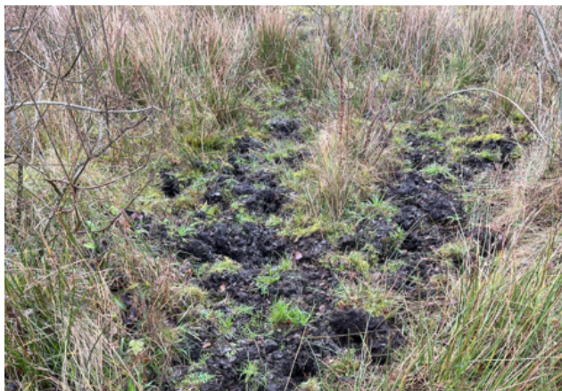
Nærbillede af dyreveksel