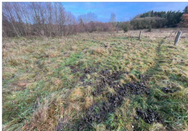
Græsningspåvirket areal med afføring